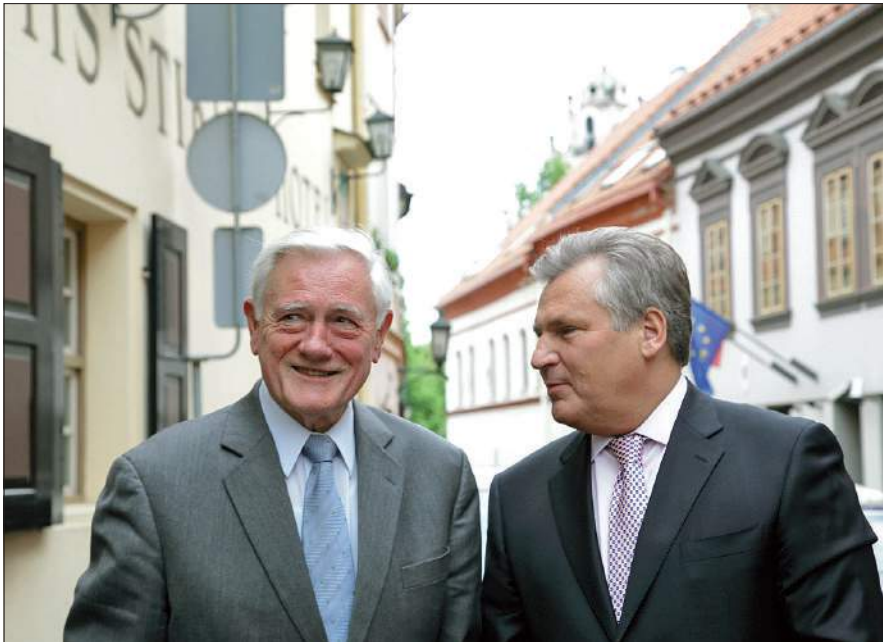
Prezidentai Valdas Adamkus ir Aleksanderis Kwaśniewski Vilniuje prie „Stiklių“ restorano.

Helsinkio grupės lyderiu, dažnai derybų metu stebindamas mane nepaprastu sumanumu ir poveikumu. Be to, jis didino mūsų patikimumą ir pasitikėjimą mūsų Europos dalimi.