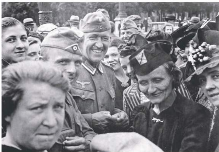
Vokiečių kariai ir prancūzų civiliai, 1940-ieji.

SAVAIME SUPRANTAMA, DIDELI VIEŠBUČIAI VISADA BUVO SOCIALINĖS SĄVOKOS, TOBULI VEIDRODŽIAI, TIKSLIAI ATSPINDINTYS BENDRUOMENES, KURIAS APTARNAUJA.