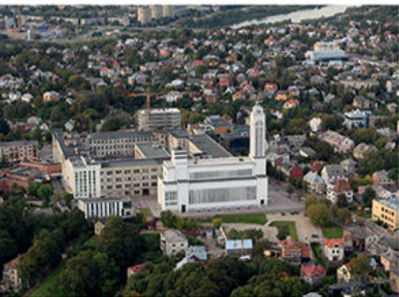
KRISTAUS PRISIKĖLIMO BAZILIKA