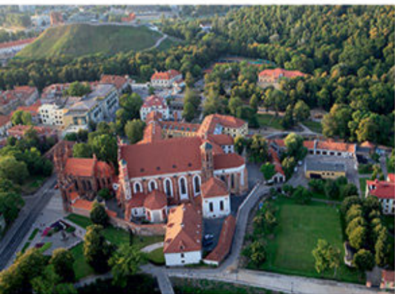
ŠV. PRANCIŠKAUS ASYŽIEČIO (BERNARDINŲ) BAŽNYČIA

Vilniaus pranciškonų observantų (bernardinų) konventą fundavo Lietuvos didysis kunigaikštis Kazimieras Jogailaitis, 1469 m. vienuolijai paskyręs žemės sklypą tuometinio miesto pakraštyje. Pirmoji bažnyčia buvo medinė, tikslesnių žinių apie jos architektūrą nėra, tačiau žinoma, kad šventovė kartu su kitais vienuolyno pastatais sudegė per 1475 m. gaisrą. Pradėtas atstatyti ansamblis dar kartą buvo apgriautas 1477 m. patvinusios Vilnios upės. Nauja mūrinė bažnyčia ir vienuolynas iškilo apie 1490 m., tačiau apie 1500 m. dėl konstrukcijos klaidų ir nekokybiško mūro šventovė ėmė griūti. Ji buvo visiškai išardyta, paliekant tik zakristiją ir presbiterinę dalį. Bažnyčios atstatymo ir įrengimo darbai buvo baigti iki 1512 m. rudens. Konvento statybą daugiausia finansavo Kazimieras Jogailaitis, jam mirus – Aleksandras Jogailaitis. Statybas rėmė ir kiti didikai, ypač Radvilos. Ansamblis yra laikomas ryškiu „fundatorių stiliumi“ pavyzdžiu, nes išsiskyrė savo puošnumu, buvo gerai aprūpintas. Nors prabanga prieštarauja pranciškonų kuklumo ir neturto principams, tačiau vienuoliai taip pat buvo mokomi nuolankiai priimti tai, kas aukojama, dovanojama, prisitaikyti prie vietos aplinkybių.