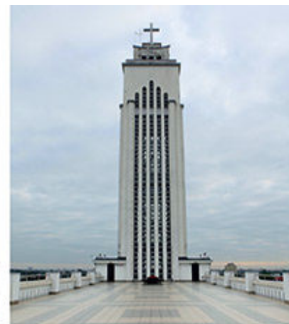
IŠ VIRŠAUS Į DEŠINĘ ŠILUVOS ŠVČ. MERGELĖS MARIJOS KOPLYČIA KRISTAUS PRISIKĖLIMO BAZILIKOS TERASA CENTRINĖ NAVA