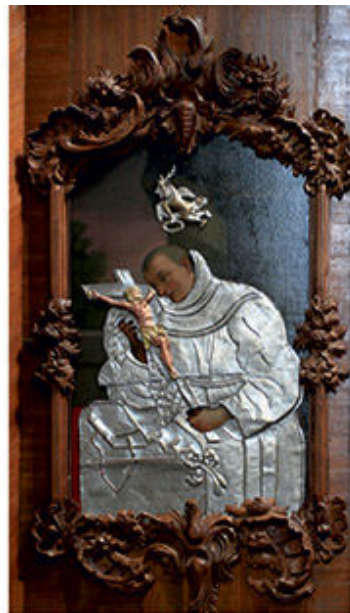
IŠ VIRŠAUS Į DEŠNĮ SĄKYKLOS FRAGMENTAS PAVEIKSLAS „ŠV. DIDAKAS“ CENTRINĖ NAVA