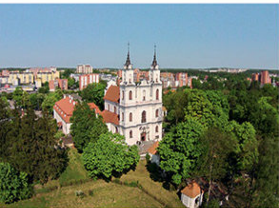
ŠV. KRYŽIAUS ATRADIMO (KALVARIJŲ) BAŽNYČIA