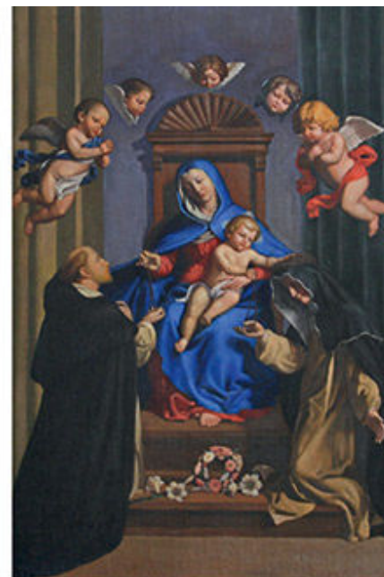
IS VIRŠAUS Į DEŠINĖ ŠONINIS ALTORIUS ROŽINIO ŠVČ. MERGELĖS MARIJOS PAVEIKSLAS CENTRINĖ NAVA