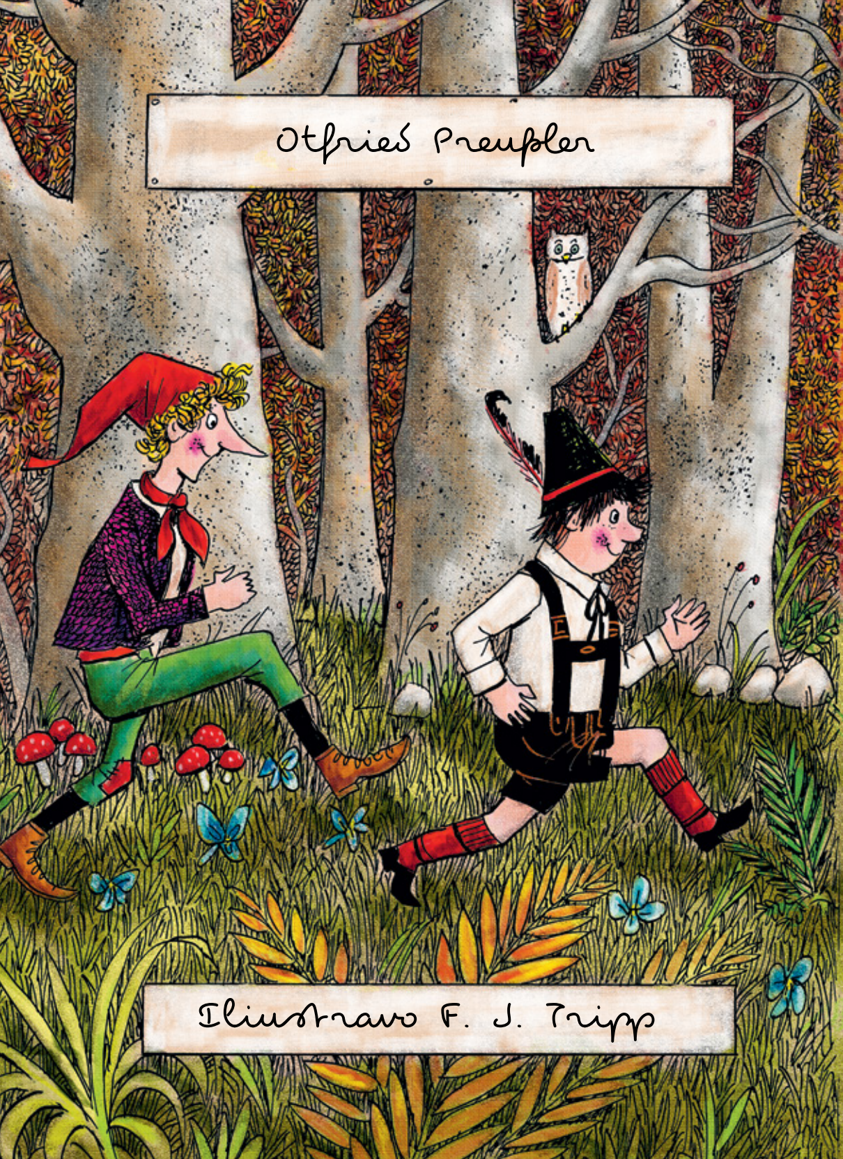
Illustration F. J. Tripp