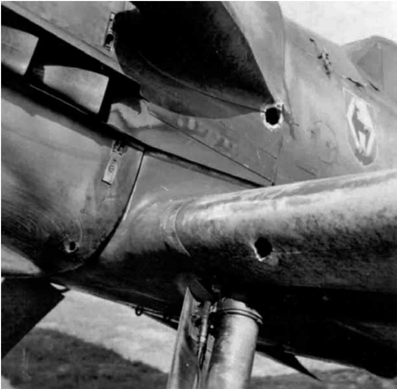
Kulkų išmuštos skylės „Messerschmitt 109“ korpuse.

– Gerasis Dieve! Man dar pasisėkė. Truputį arčiau ir būčiau iškeliavęs į aną pasaulį. Iš kur ši tepalo dėmė? Variklis, atrodo, nepažeistas.