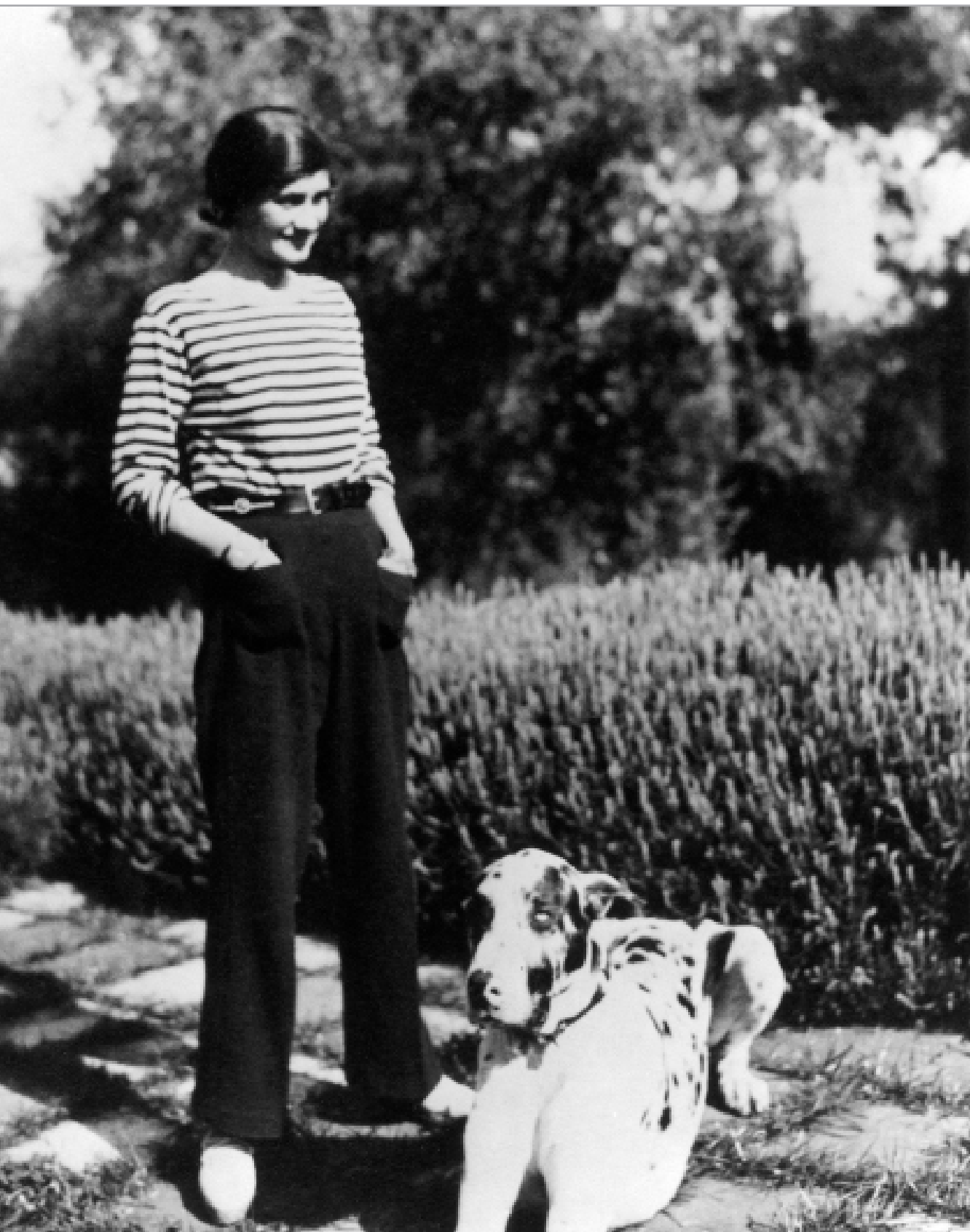
Coco Chanel vilki jūreiviško stiliaus palaidinę ir džersio kelnes, apsupta levandų viloje „La Pausa“ Prancūzijos Rivjeroje. Prie kojų – jos šuo Gigot.