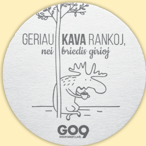
Prekybos centras GO9: kvepiantys kavos padėkliukai.

Šiuolaikinis žmogus gyvena masinių komunikacijų amžiuje. Vartotojiškoje visuomenėje ypač populiari reklama. Ji žurnaluose, laikraščiuose siūlo produktus, iškelia jų vertę, pranašumus prieš kitus tokius produktus. Reklamai pasirenkami literatūros, mitologijos, folkloro personažai, motyvai. Pavyzdžiui, mitologiniai personažai reklaminio kavos „Lavazza“ 1997 metų kalendoriuje yra angelas, besiilsintis ant apversto kavos puodelio, ir velnias, ant rodomojo piršto galiuko iškėlęs milžinišką cukraus gabalą. Abu mitologiniai personažai stipriai stilizuoti. Angelo personažui suteikiamas tyrumo, švelnumo, romantiškos emocijos įvaizdis. Velnio personažą įkūnija tamsios spalvos, aštrūs kampai, rėkminga, nerami nuotaika. Pateiktose iliustracijose matote reklamos pavyzdžius su tautosakos literatūros motyvais. Atpažįstate juos?