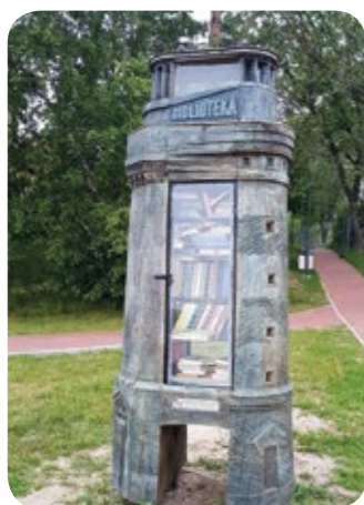
Knygų namelis Nidoje

Minint Pasaulinę švyturių dieną Nidoje, Kuršių marių pakrantėje, atidaryta dar viena tokia bibliotekėlė – švyturio pavidalo knygų namelis.