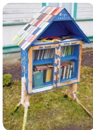
Knygų namelis Druskininkuose