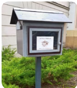
Knygų namelis Vilniuje