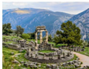
Atėnų Akropolis, Atėnai, Graikija