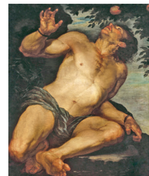
Džoakinas Aseretas, Tantalas , 1630–1640 m.