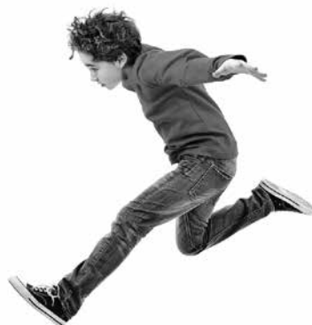
Bėga ( kaip? )