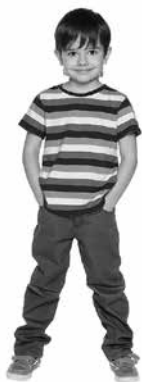
Stovi ( kaip? )