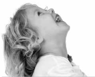
Juokiasi ( kaip? )